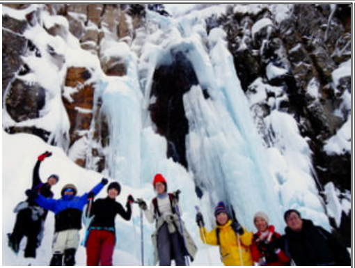
秘境 イワナ沢の天上の滝

今日のツアーは25日に見つけたばかりのイワナの沢の天上の滝に氷瀑を見に行きました。昨夜に雪が降ったばかりで、山に新雪が積もり木々に着いた雪がきれいでした。イワナの沢の滝まで廃道になった林道の雪道を歩いて1.5km40分の程よい行程です。遠くに見える滝は、真っ青に凍って見えます。