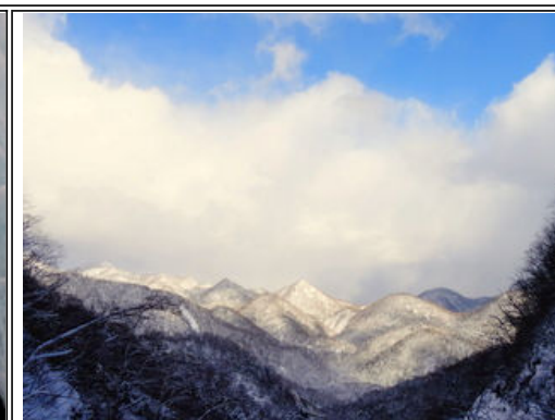
白老山系も きれいに見えます

この滝は雪崩の心配もないので滝の下で、ゆっくり昼食を食べました。正面には白老山の山々がきれいに見えます。まるで山に登ったような絶景が広がります。真っ白な山々を見た後に振り返ると、さらに滝が青く見えます。12月にこれだけの氷瀑はめずらしくて、12月のツアーとしては良いコースが見つかりました。年明けにもぜひツアーで案内しますので楽しみに来てください