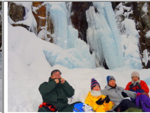
凍る滝の前でお昼ご飯

緩やかな登りを歩いて滝の下まで来ました。ここから滝までは50mの登りです。一昨日に作ったルートは雪で覆われてしまって、ラッセルしながら上がります。近づくにつれて滝の青さが増してきます。滝の真下に入ると青空が広がりました。滝のから降り注ぐ水滴がキラキラと輝いています。神秘的な情景に感動です。