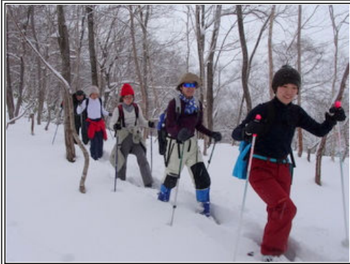
秘境の滝へスノーシューツアー