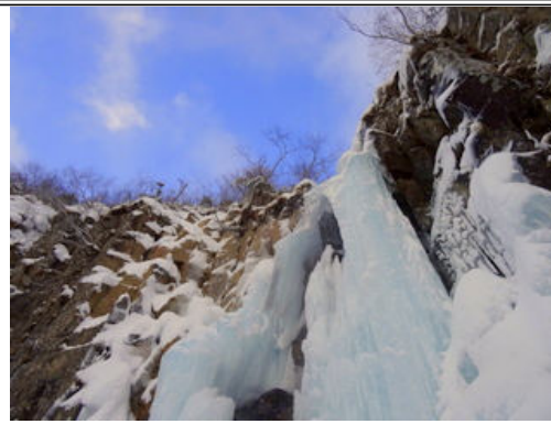
滝の上に青空が広がりました