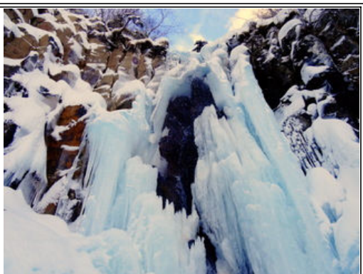
まるでガリガリ君のソーダーの色

緩やかな登りを歩いて滝の下まで来ました。ここから滝までは50mの登りです。一昨日に作ったルートは雪で覆われてしまって、ラッセルしながら上がります。近づくにつれて滝の青さが増してきます。滝の真下に入ると青空が広がりました。滝のから降り注ぐ水滴がキラキラと輝いています。神秘的な情景に感動です。