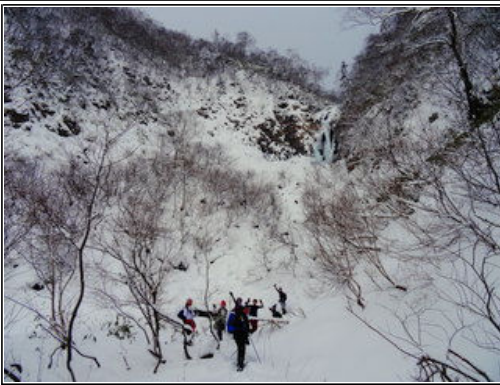
天空に架かるイワナ沢の滝